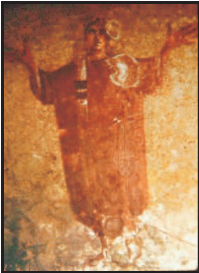
Figura central de un fresco compuesto por un total de tres escenas, la cual representa una mujer con un velo sobre su cabeza que se encuentra en posición orante (símbolo del alma que vive ya en la paz divina).

Trinidad: explica claramente la presencia de la Trinidad en el Antiguo Testamento: Tres Personas en un sólo Dios: “ Hagamos al hombre a nuestra... ” (Génesis 1, 26), lo dice el Padre al Hijo y al Espíritu Santo (Ireneo los llama alegóricamente “ las manos de Dios ”). Asimismo, insiste en la “ monarquía divina ”, Cristo y el Espíritu Santo actúan en el Antiguo Testamento junto con el Padre.