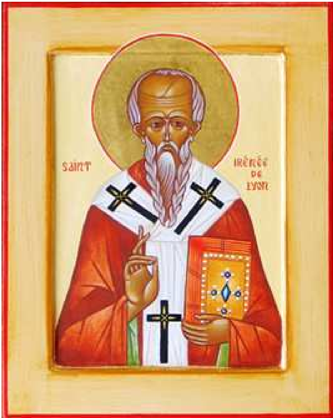
San Ireneo de Lyon